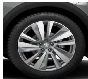
Jante aliaj 19" WASHINGTON (optional Allure / GT line)