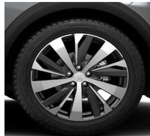
Jante aliaj 19" NEW YORK (optional GT)