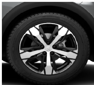
Jante aliaj 18" LOS ANGELES (CU OPTIONAL Grip Control)