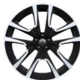
Accessorii 22", 5 spițe duble