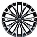
Accessorii 22", 10 spițe